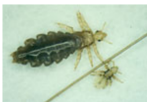
En voksen hunlus på 3 mm og en lille nymfe på ½ mm

En lus begynder sit liv som et lille æg, der er limet fast på håret helt inde ved hovedbunden, hvor der er varmt og fugtigt. Efter 6-9 dage klækker den som en lille nymfe. Nymfen suger blod flere gange om dagen, vokser og skifter hud tre gange og er nu blevet til en voksen kønsmoden lus. Det tager 9-12 dage. En voksen hunlus kan blive 3 uger gammel og kan lægge mindst 5 æg om dagen.